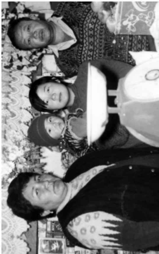
Автор үй-бүлөсү менен.