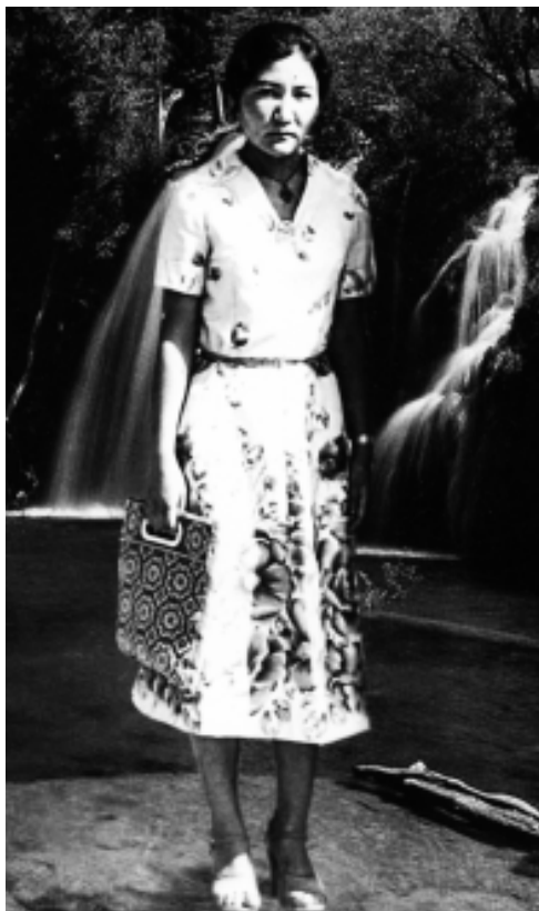
Автор Жумакан Калилова Жаштык