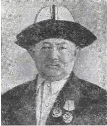
Манасчы Саякбай Каралаев