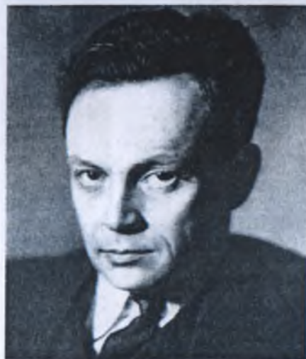
ЮРИЙ НИКОЛАЕВИЧ ТЫНЯНОВ