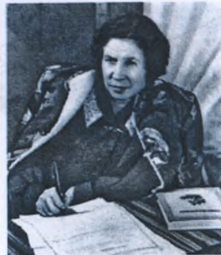
ВАЛЕНТИНА АЛЕКСАНДРОВНА ОСЕЕВА